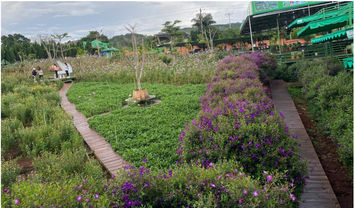
Một góc quán cà phê Mê Linh, Đà Lạt

vẻ đẹp của những rừng thông, những con thác treo leo mang màu sắc kì bí, tất cả đều tuyệt mỹ trong đôi mắt của tôi.