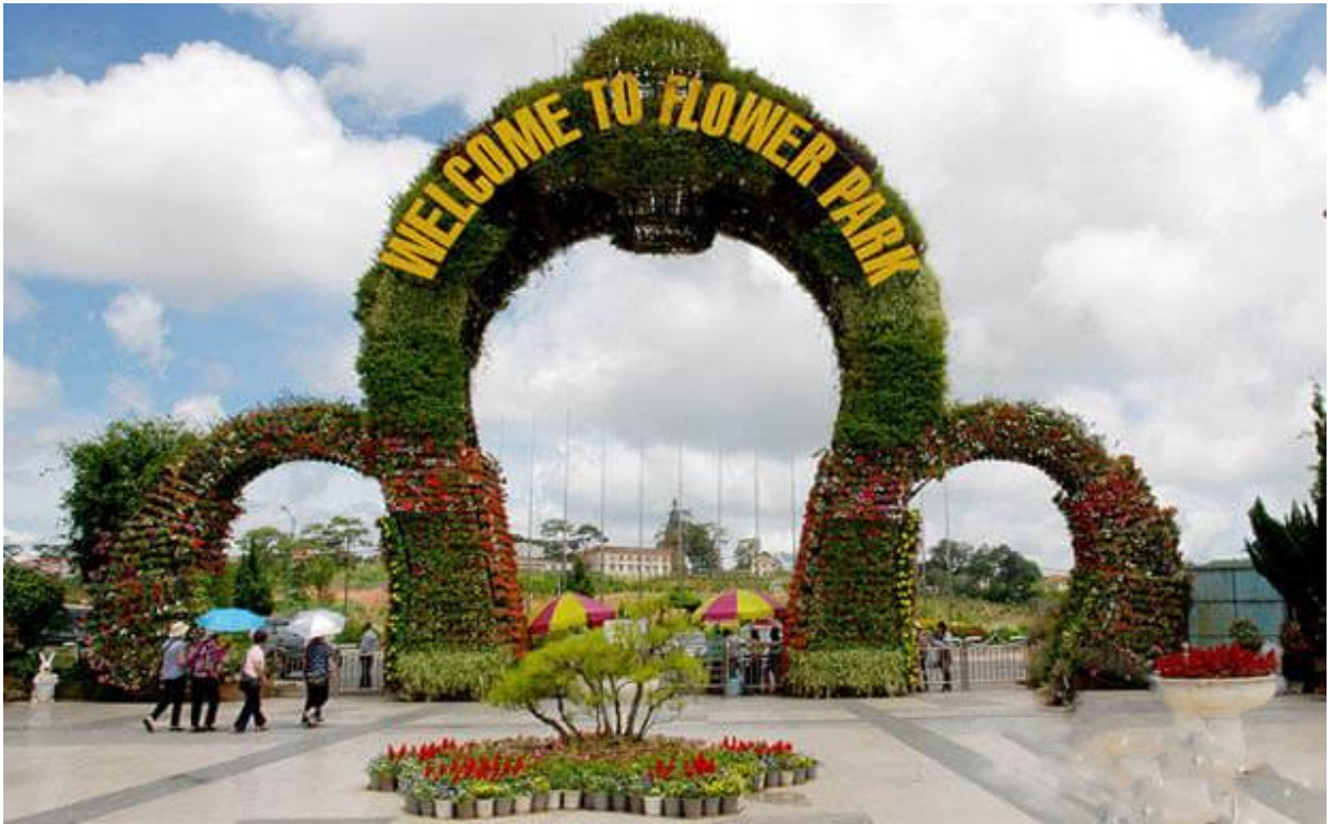
Vườn hoa Đà Lạt

Điểm tiếp theo chúng tôi tham quan, đó là “Khu triển lãm nghệ thuật và giải trí ứng dụng nghệ thuật số” đầu tiên tại Việt Nam - Vườn Ánh Sáng Lumiere Đà Lạt.