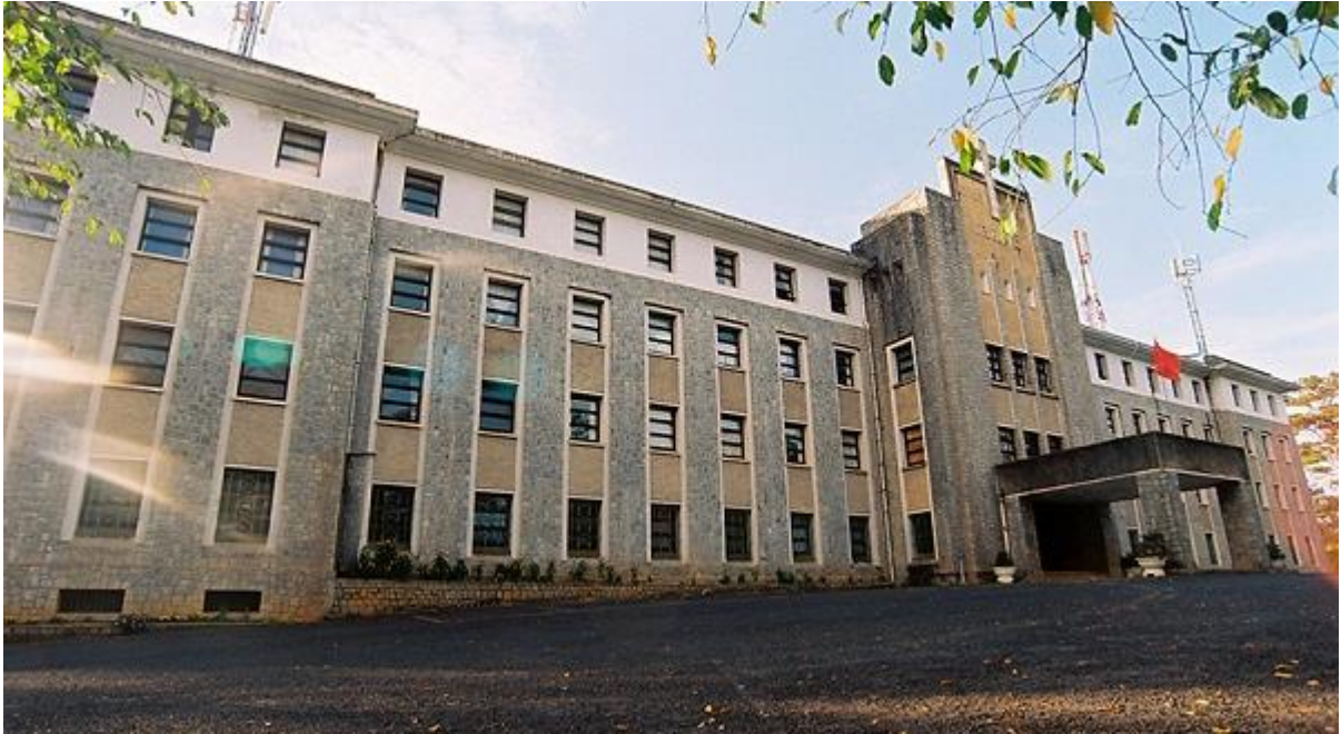
Viện nghiên cứu Khoa học Tây Nguyên, Đà Lạt

của châu Âu! Toàn bộ bảo tàng được làm bằng đá, mang lối kiến trúc gothic kiểu Pháp với rất nhiều ô cửa.