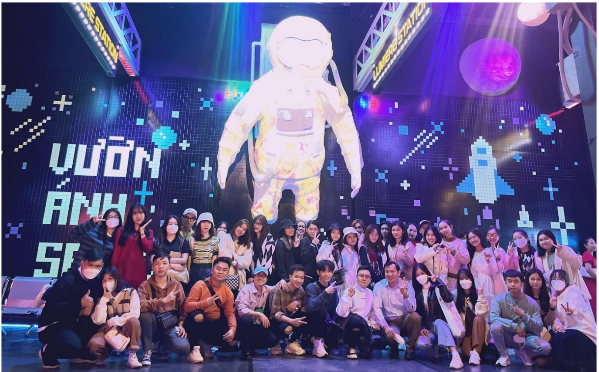
“Khu triển lãm nghệ thuật và giải trí ứng dụng nghệ thuật số” - Vườn Ánh Sáng Lumiere Đà Lạt.

Điểm tiếp theo chúng tôi tham quan, đó là “Khu triển lãm nghệ thuật và giải trí ứng dụng nghệ thuật số” đầu tiên tại Việt Nam - Vườn Ánh Sáng Lumiere Đà Lạt.