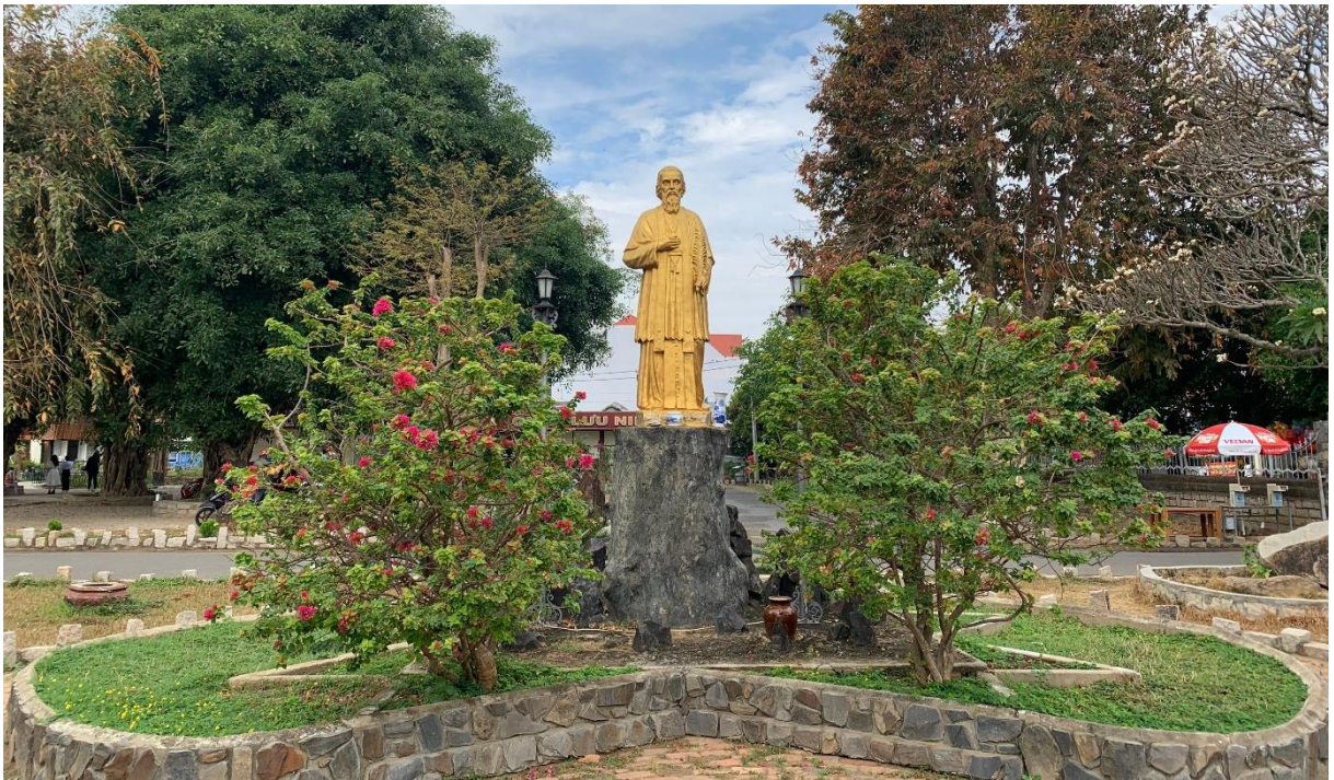
Tượng Đức Cha Martial Jannin Phuróc được đặt trong khuôn viên nhà thờ

triển của cộng đồng, của các tộc người Tây Nguyên. Bên cạnh đó, vật liệu xây dựng nên nhà thờ cũng rất đặc biệt, không phải bằng gạch đá như những nhà thờ khác, mà kiệt tác này được tạo nên bởi một loại gỗ rất đặc biệt, gỗ sến đỏ (hay cà chít), loại gỗ đặc trưng cho vùng đất Tây Nguyên. Tòa giám mục sử dụng nhiều gỗ màu trầm toát lên vẻ cổ kính, uy nghiêm và phảng phất không khí núi rừng, màu nâu của gỗ cùng những đường nét họa tiết tạo nên vẻ đẹp mang đậm sắc thái văn hóa, tín ngưỡng của người nơi đây. Bao quanh Tòa giám mục là khuôn viên rộng với nhiều cây lâu năm. Nổi bật là hai hàng cây sứ rợp bóng mát ở lối vào, mang đến vẻ bình yên.